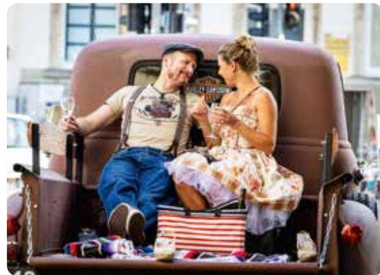
07.09.2024 Gutt Musek a flott Stëmmung um Rockabilly Deluxe am Parc Théophile Kirsch