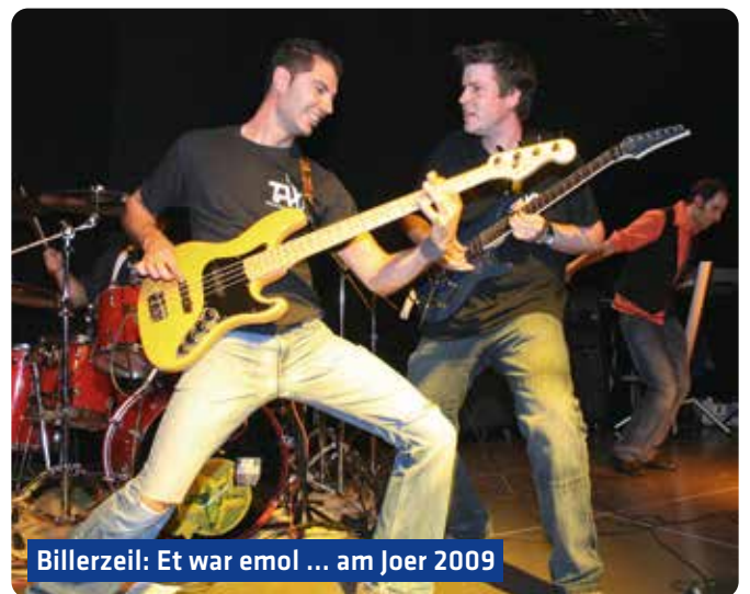
Billerzeit: Et war emol ... am Joer 2009

Et sief dann och nach gesot, datt jiddfer Grupp 20-30 Minutten op der Bühn steet an d'Prouwen am AUDEO – den Tounstudio vun der Gemeng Péiteng – sinn 2 Woche virum Concours.