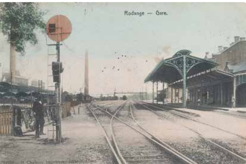
△ 1920 er ▽