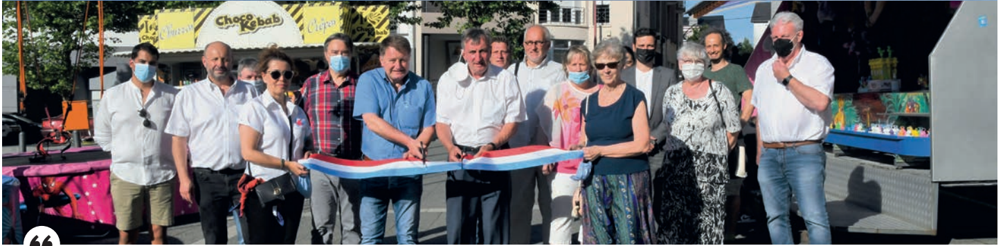
“ 10.06.2021 - C'est avec le traditionnel «Hämmelsmarsch» des musiciens de l'Harmonie municipale de Pétange ainsi que la coupure du ruban tricolore que la fête foraine à Pétange fut officiellement ouverte par le Syndicat d'initiative et de tourisme de Pétange, ceci en présence d'un bon nombre d'élus de la commune. Au plaisir des enfants mais aussi des adultes qui ont savouré l'atmosphère de la kermesse.