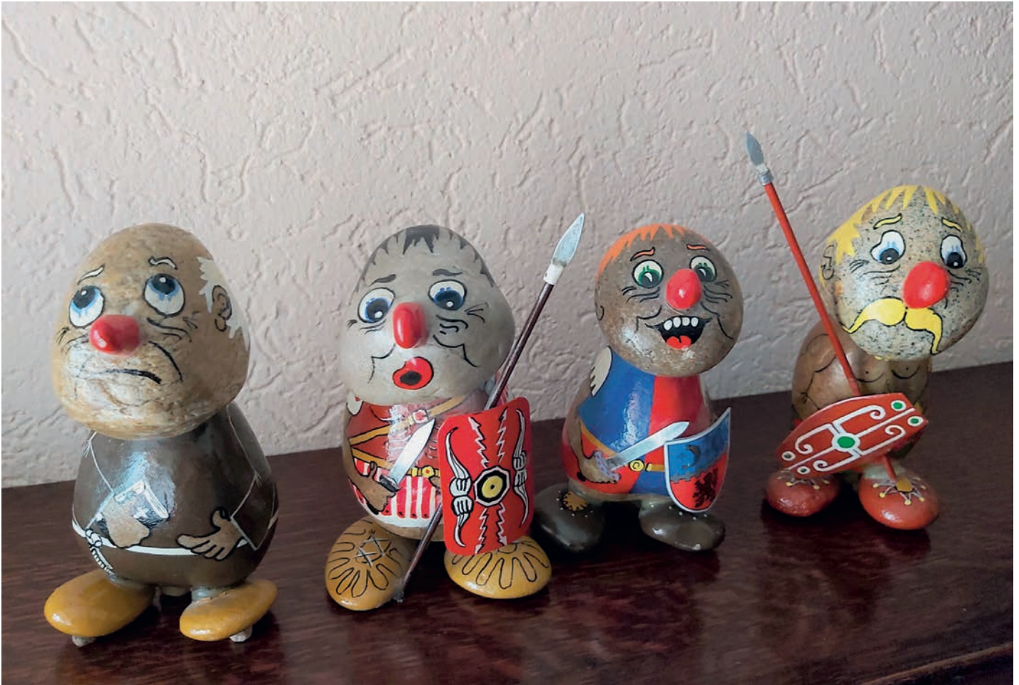
Bunt, frech und dennoch zum Knuddeln...die Steinmännchen haben sogar Fans bei der Londoner „Fire Brigade“ und in Übersee

besonderen Minettellandschaft waren so wie das Gasthaus „Bei der Giedel“ im Fond-de-Gras. Farbenfroh ging es weiter, als er sich von der Farbpalette der Aquarellmalerei angezogen fühlte. Ein Entschluss, den er nicht bereut hat, denn seine Bilder strahlen das lebhaftige und lustige Gemüt des Künstlers wieder. So zeichnet er seit Jahren Szenen aus der Stadt Luxemburg mit einem historischen „Touch“ indem er beispielsweise geschichtliche Figuren wie Peter-Ernst von Mansfeld oder Soldaten aus längst vergangenen Zeiten mit einbindet. Augenblicklich arbeitet er an einem Buch mit dem Titel „Wat soll et da sinn, Madamm?“ (am Editionsprogramm vun den „Amis de l'Histoire“) über die Geschäftswelt in der Petinger