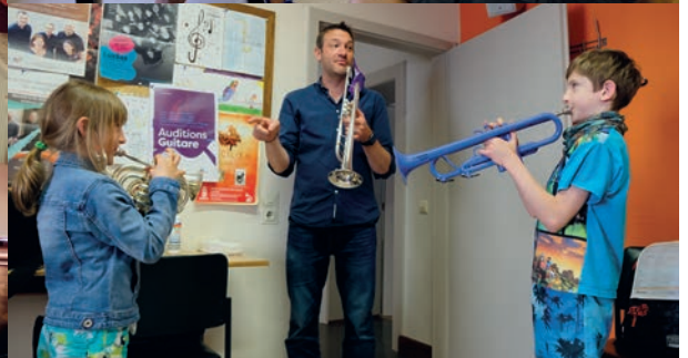
“ 11.06.2021 - Sei es Trompete, Klavier oder Batterie, der Tag der offenen Tür in der Petinger Musikschule hatte auch in diesem Jahr zahlreiche kleine und große Musikanten angezogen. Mit guter Laune wurden die Instrumente im Beisein der Lehrbeauftragten „getestet“ und so mancher Gast war im Anschluss begeistert von den Klängen, die er/sie hervorzauberten.