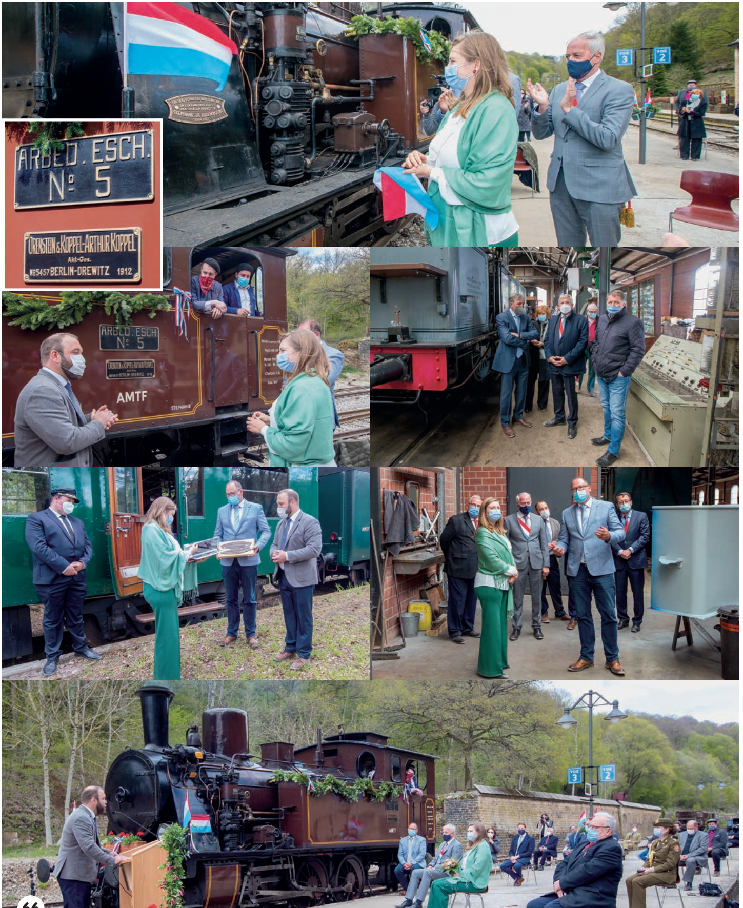
“ 30.4.2021 – Am Fond-de-Gras war viru kuerzem héiche Besuch ugesot ewéi d'Ierfgroussherzogin Stéphanie de Wee an de Süde fonnt hat fir d'Lokomotiv 5 ARBED / ESCH op den Numm Stéphanie ze deefen. Donieft stoungen eng Visite vun der Remise esouwéi eng Fahrt mat dem Train 1900 bis an de Fuussbësch um Programm. En Evenement, dat hir sichtlech Freed gemaach huet.