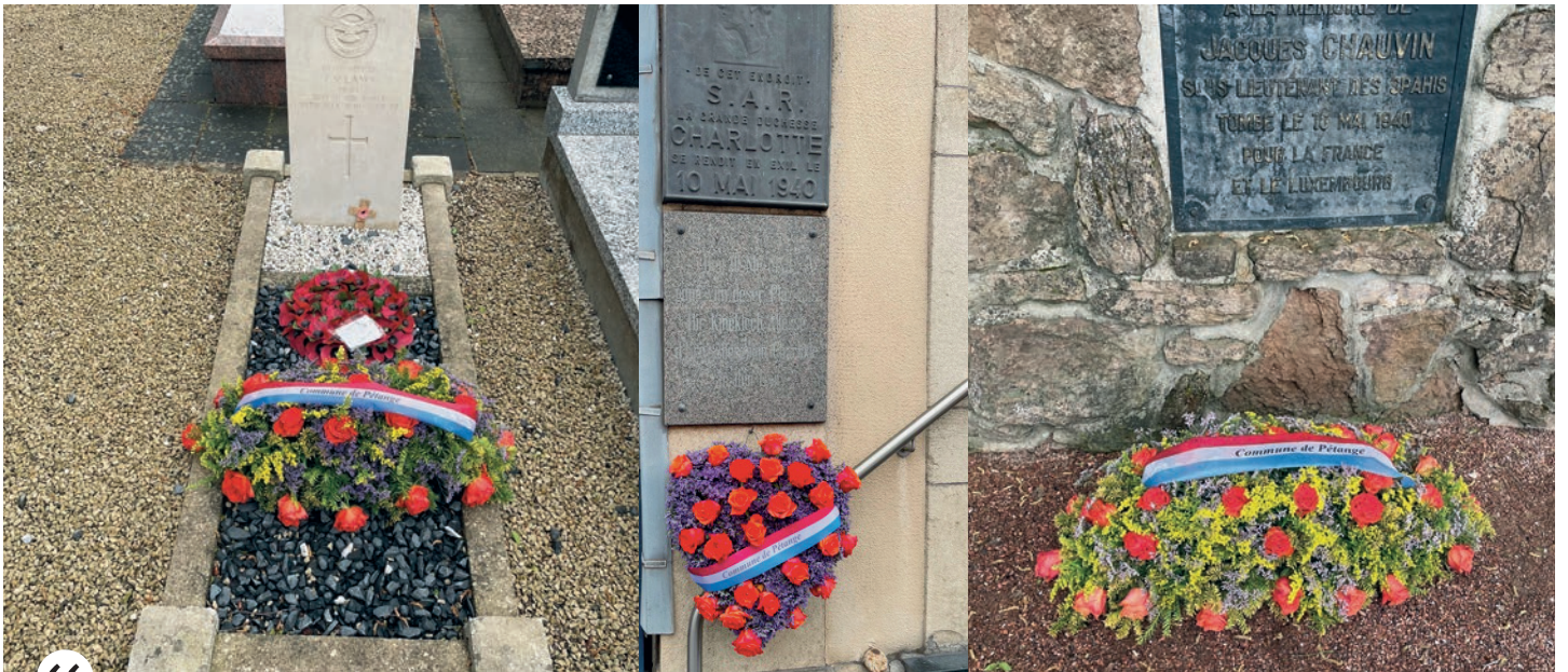
10.5.2021 - Obwuel duerch d'Coronakris keng Zeremonie um Kierfecht zu Lamadelaine stattfonnt huet, hat déi Péitenger Gemeng Blumenarrangerter op d'Griewer vun deenen Zaldote néiergeluecht, déi sech den 10. Mee 1940 unni ze zécken dem Amarsch vun den Nazi-Truppen zu Lëtzebuerg an de Wee gestallt an dësen Asaz mam Liewe bezuelt hunn. Zu Rodange op der Grenz gouf un deen Abléck geduecht, wou d'Groussherzogin Charlotte déi franséisch Grenz passéiert huet fir an den Exil ze goen.