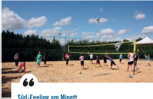
Süd-Feeling am Minett

Wee Süde seet oder denkt, deen denkt automatesch un d'Plage an de waarme Sand. Et gött zwar kee Mëttelmier zu Rolleng, dofir sinn awer Beach-Volley-Terrainen zu Lamadelaine eng gutt Méiglechkeet, de Fussball, Volleyball oder Handball emol aneschters an der frëscher Loft ze spillen. E bësse méi roueg geet et do schonn op de Boulenterrainen zu Rodange a Lamadelaine zou. Déi deels e bësse méi stänneg awer grad esou engagéiert Spiller kënnen hei vun iwwerdeckten Terrainen dobaussen (Lamadelaine) oder vun Terraine bannen a baussen (Rodange) profitéieren.