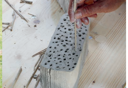
“ 20.4.2021 - „Et krabbelt a bëselt am Insektenhotel“ – esou housch eng vun den Ëmweltaktivitéiten, déi de Kanner vun der Gemeng Péteng ugebuede gëtt. Um Programm stoung en Hotel fir d'Insekten, dat déi Jonk selwer ausgestatt hu mat Dännenzapfen, Planzestängelcher, gelächert Tounzillen an nach esou munch anerem Ënnerschlupf fir déi kleng Krabbeldéieren.