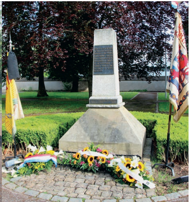
“ 28.05.2021 – Am ganz klengen Krees gouf dësere Deeg bei der Borne du Passeur un de 60. Anniversaire vun der Aweitung vun dëser Stele, déi ufanks op der Kräizung rue de l'Eglise a rue de la Chiers stoung, geduecht a Blumenarrangementer néiergeluecht.