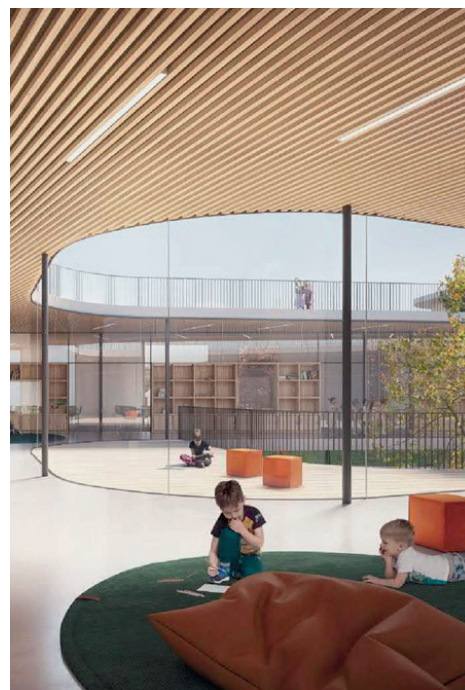
E modernen an helle Schoukplex fir Rodange

De 4. Juni 2018 gouf de „Plan pluriannuel 2018-2023“ am Péitenger Gemengerot festgehalen an domat beschloss, datt am Laf vu 5 Joer ronn 178 Milliounen Euro fir d'Bierger investéiert solle ginn. Dëse Plang setzt sech aus enger ganzer Panoplie vu Projeten zesummen, déi a 7 Kategorien oder Kapitelen ageedeelt sinn. Bis Enn 2021 gi viraussichtlech vun deene Sue schonn 131.400.000 € agesat. An dat trotz Corona-Kris, déi d'Welt esou zimlech op d'Kopp gestallt huet zënter quasi engem Joer. E Bléck op all déi Realisatiounen, déi an der Péitenger Gemeng ëmgesat solle gi weist, datt um Enn nach méi investéiert gëtt ewéi dat 2018 festgehalé gouf, an zwar am ganzen 217 Milliounen Euro (c.f. Tableau). Hei e klengen Iwwerbléck am Wuert an am Bild, wat an deene verschidde Kapitele virgesinn ass. Finanzéiert gëtt dëse „Plan pluriannuel 2018-2023“ och duerch d'Reserven aus der leschter Mandaatsperiod, duerch d'„Dotation“ vum „Pacte Logement“ an och en Deel duerch d'Emprunten.