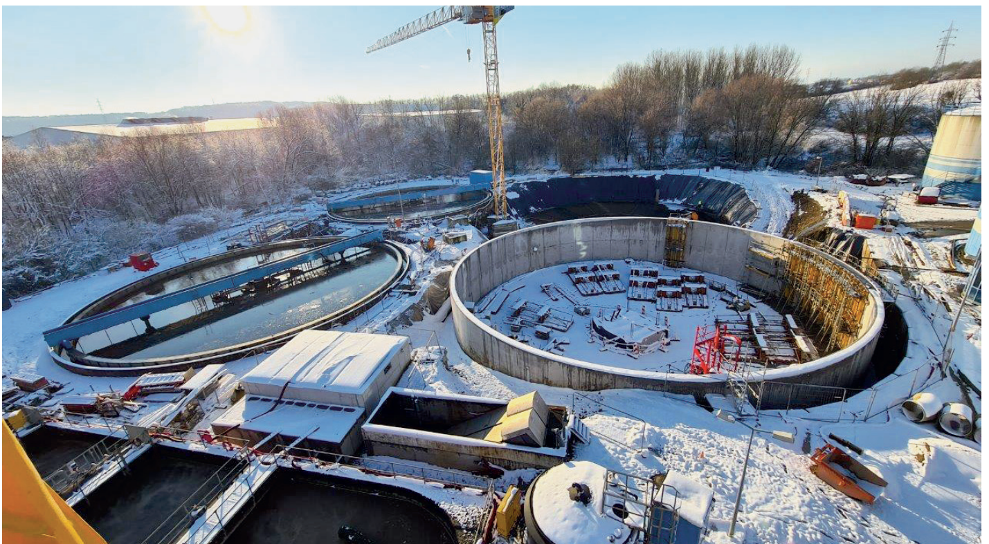
... an dat am ganze Kordall

pompwierk, dem Sandfang an de Beliewungsbecken sinn och nach en zousätzlecht Noklärbecken ewéi e Schlamm-lagergebai inklusiv De-Amonifikatioun an eng Vergrësserung vum administrative Bau an dësem Projet virgesinn. Doriwwer eraus soll an Zukunft nach eng 4. Rengungsstuf (Mikroschuedstoffeliminatioun) hei funktionéieren. Dës Aarbechten, wou sech déi 4 Membersgemenge Péteng, Käerjeng, Déifferdeng a Suessem esouwéi den Ëmweltministère un de Käschte bedeelegen, sollen 2024 fäerdeg sinn.