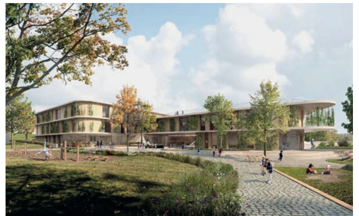
Rodange kritt e richtege Schoulkomplex