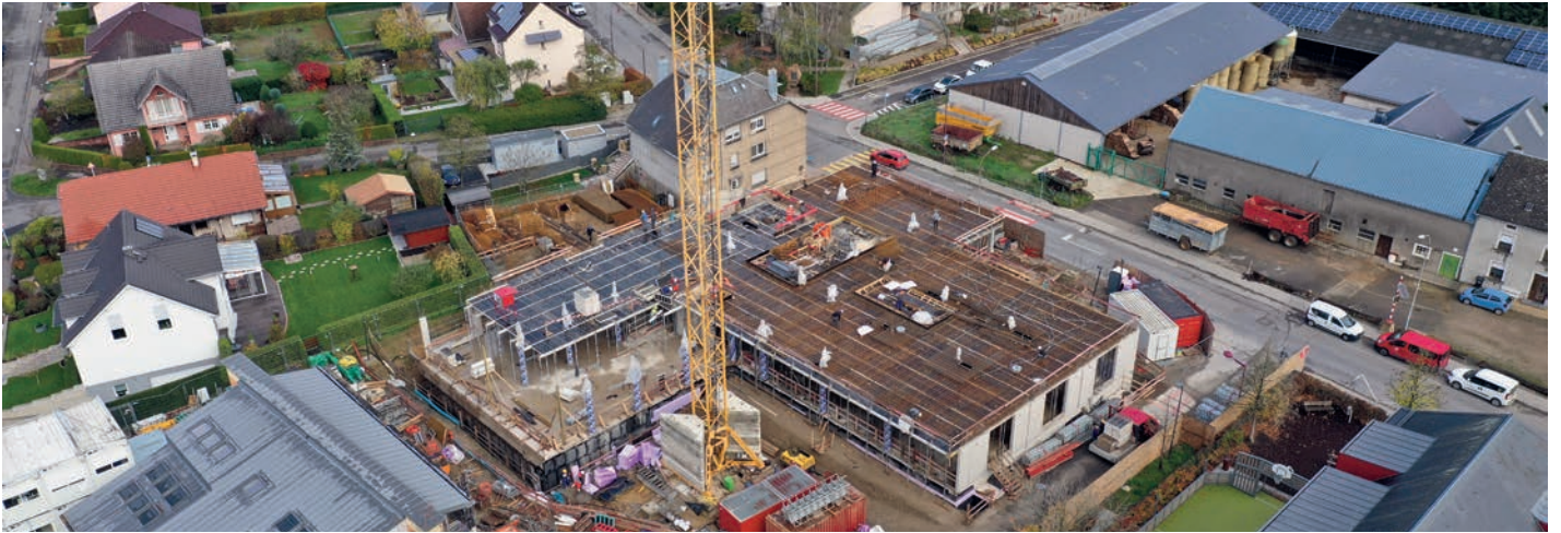
Am Bau: d'Schoul an d'Maison Relais zu Lamadelaine

„Enseignement fondamental, Maisons Relais et Crèches“ – bannent 6 Joer sinn Investissemter an enger Héicht vu 26 Milliounen Euro geplangt. Bis ewell si scho ronn 17 Milliounen investéiert ginn, a bis 2023 soll de Gesamtinvest am ganze mat 46 Milliounen Euro zu Buch schloen. Heirënner falen d'Konstruktioun vun der neier Maison Relais an der Spillschoul zu Lamadelaine, awer och de Projet vun der neier Maison Relais zu Péiteng esouwéi den Ausbau vun der Eigent-Schoul, wou eng ganz Rei nei Klassesäll entstinn.