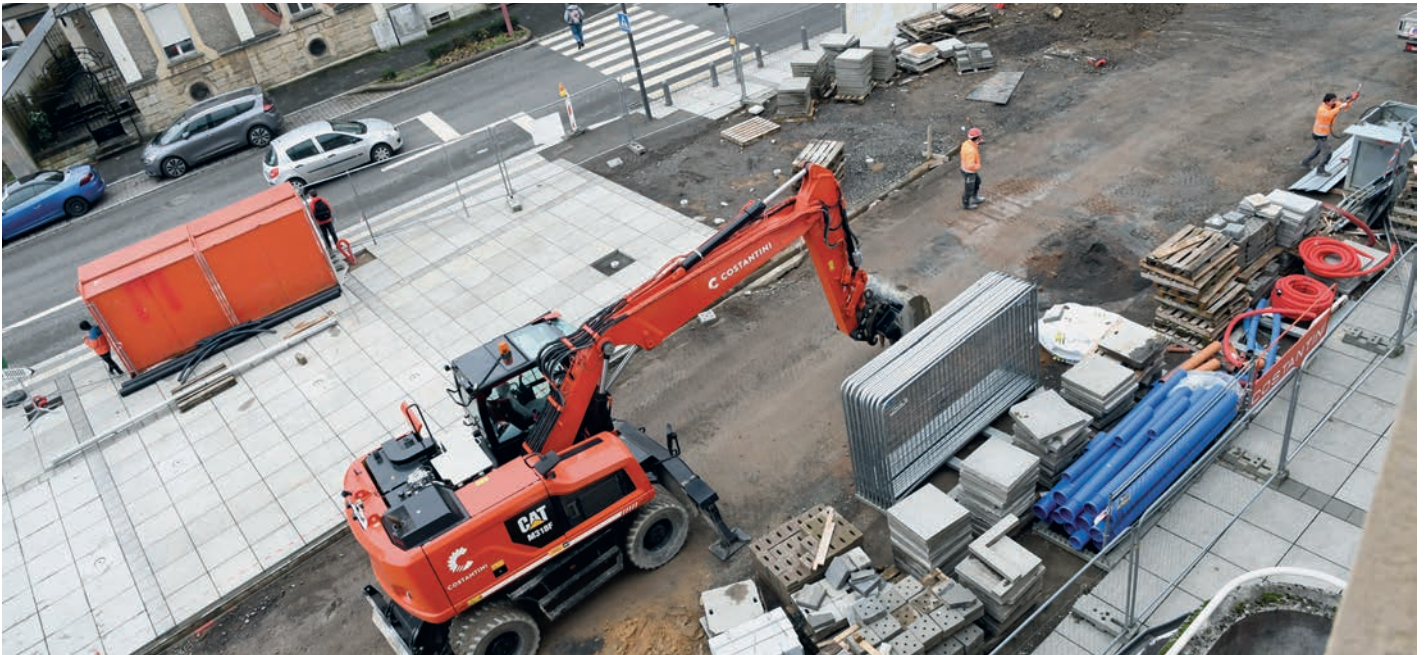
D'Gemengeplaz zu Péiteng soll méi aluedend ginn

Och am Beräich „ Infrastructures routières, places et réseaux “ deet sech esou munches op Gemengenniveau. Bis Enn 2021 soll knapp d'Halschent vun den Investissementer, d.h. 66 Milliounen Euro, déi bis 2023 virgesi waren, scho verschafft sinn.