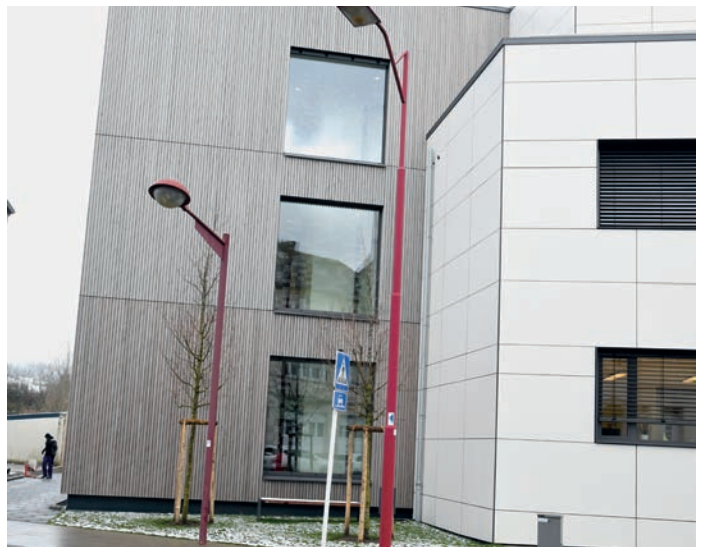
D’Haus bei der Kor gouf vergréissert