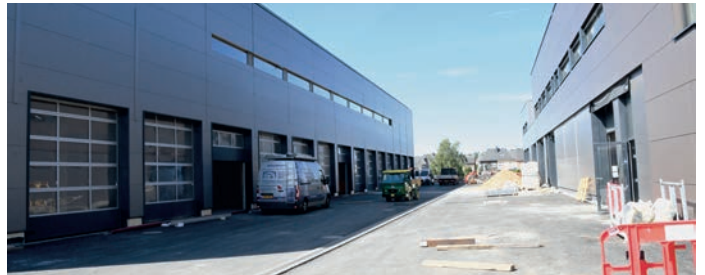
An den Ateliere ginn d’Regiebetriber zentraliséiert

Net wäit dovun ewech ginn an noer Zukunft d’Gemengenatelieren installéiert. D’Gebaier stinn, wat feelt sinn nach all déi kleng Aarbechte ronderëm ewéi déi baussecht Anlagen, déi nach fir d’Zesummeleeë vun de Regiebetriber op dësem Site mussen an d’Rei gemaach ginn.