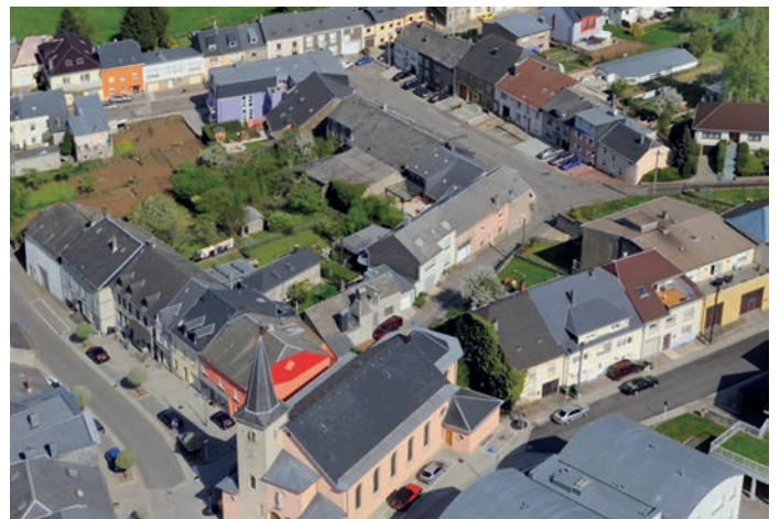
Den Zentrum vu Rolleng gëtt nei gemaach