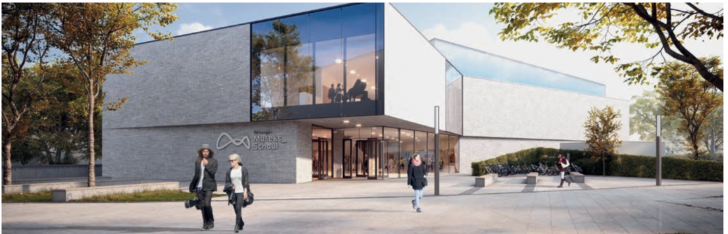
Zukunftsmusik : déi nei Musiksschoul zu Péiteng gëtt en „Hingucker“