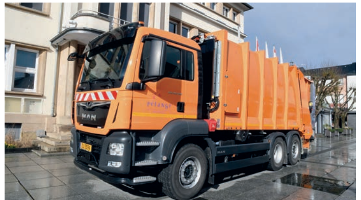
De Fuhrpark gouf moderniséiert

Wann hei Investissementer vun 8,3 Milliounen Euro tëscht 2018 an 2023 virgesi waren, esou wäerten dat bis 2021 ronn 3,22 Milliounen sinn. Schlussendlech bleift d'Gemeng awer ënner dem initialen Investissement mat 7 Milliounen Euro.