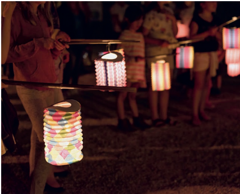
Lichtmëssdag, ëmmer nees en Erlefnis fir d'Kanner

Léiwer Härgottsblieschen, Gitt ons Speck an Ierbessen Ee Pond, zwee Pond, Dat anert Joer da gitt der gesond, Da gitt der gesond. Loosst déi jonk Leit liewen An déi al derniewent Kommst der net bal, D'Féiss ginn ons kal. Kommst Der net gläich, Da gi mer op d'Schläich. Kommst der net geschwënn, D'Féiss ginn ons dënn. Kommst Der net gewëss, Da kritt Der e Schouss voll Nëss.