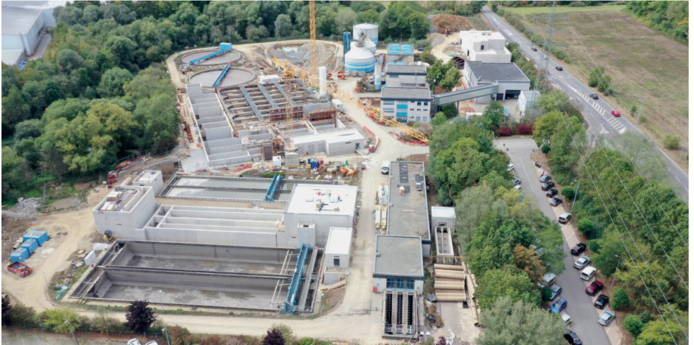
De SIACH schafft mat dësem Bauprojet d'Grundlag fir en optimale Fonctionnement....

Wee „ Syndicats intercommunaux “ seet, deen denkt bei Péteng direkt un de SIACH, un d'Klärnlag, déi net ophält ze wuessen. Vun deene 6,37 Milliounen Euro, déi hei sollten iwwer d'Period 2018-2023 investéiert ginn, ass no 4 Joer näischt méi Rescht an et muss een éischerter vun enger Totalzomm vun 10 Milliounen Euro Investissementer hei ausgoen - dat ass d'Partizipatioun vun der Gemeng Péteng eleng. Firwat dësen héichen Invest? Eis Klärnlag gëtt ausgebaut fir 115.000 Awunner Gläichwerter. Nieft der Erweiterung vum Schnecke-