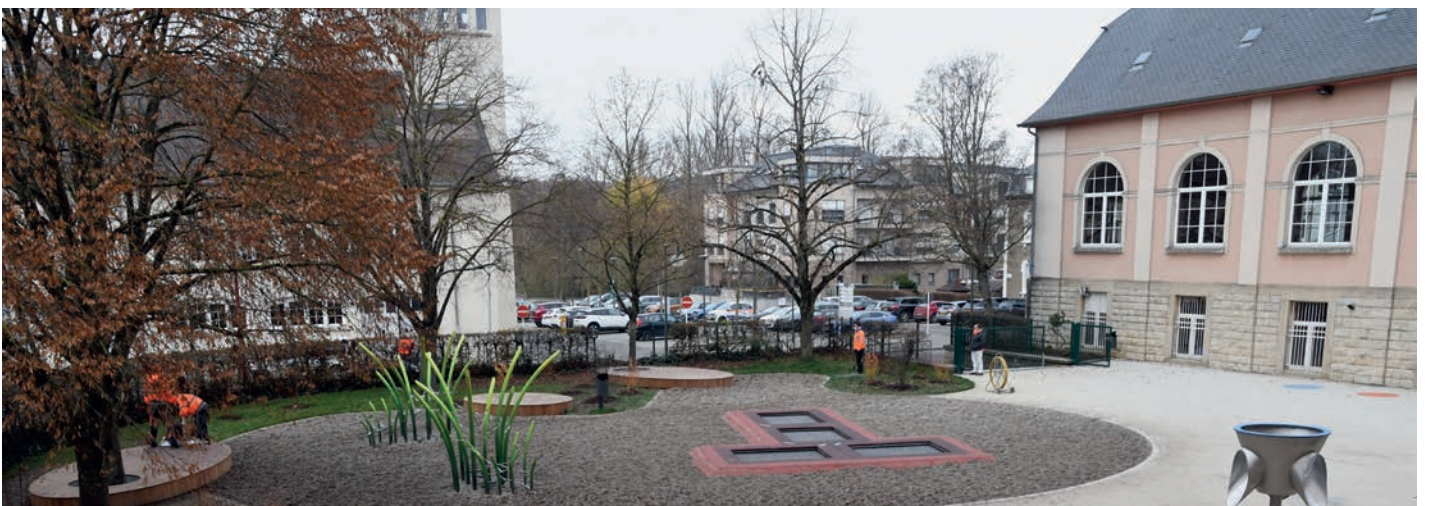
Park-Schoul zu Péiteng: e Schoulhaff fir sech auszutoben