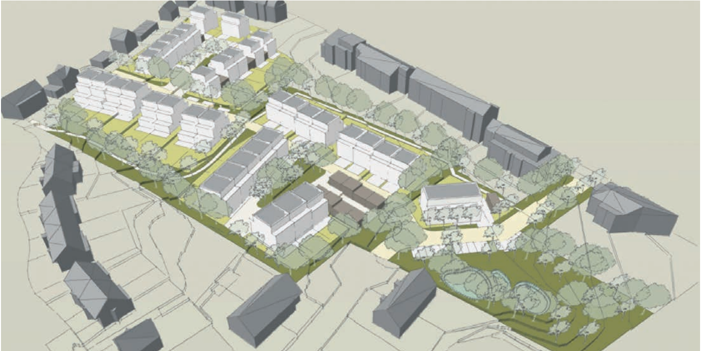
Neiwiss 2, e gringje Projet entsteet zu Rodange

Lamadelaine a Rodange sti ganz uewen am Kapitel „ Urbanisation et lotissements “, wou net zulescht mat der neier Cité „An Atzengen“ eng ganz Rei Famillje mat Kanner hir Chance kruten, zu Rolleng en Haus ze kafen. Donieft goufen och Residenzen opgeriicht, wou Wunnenge verkaft respektiv verlount sinn. Dat an Zesummenaarbecht mat der SNHBM.