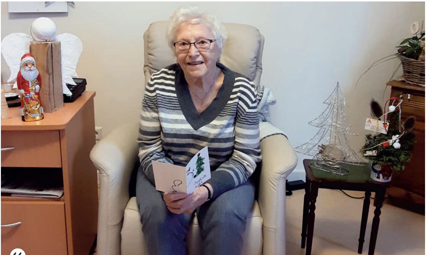
“ Dezember 2020 – Esou just virun der Chrëschtvakanz goug et an der Maison Relais „Bei de Bujellien" zu Rodange héich hir, well un de Chrëschtkoarte fir d'Leit an der Seniorie gebastelt gouf. Eng Iwerraschung, déi bei de Pensionäre groussen Uklang fonnt huet, och wann si hir Freed net perséinlech mat de Kanner konnten deelen. Et huet awer esou munch A laache gelooss. E klenge Liichtbléck a COVIDI-19-Zäiten.