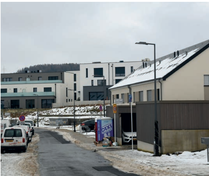
„An Atzengen“, en neie Wunnquartier zu Rolleng

Mam Kaf vum Bauerenhaff an der Burgaass gëtt och d'Fondatioun vun engem méi liewegen Zentrum vu Lamadelaine geluecht. Am Joer 2021 soll hei mat den Etüdë fir dësen urbanistesche Projet ugefaange ginn.