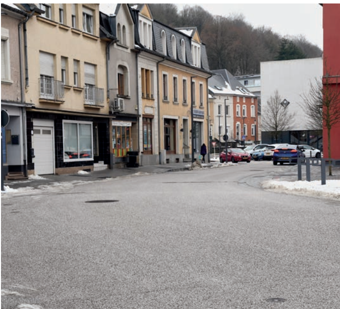
Am Zentrum vu Rodange stinn d'Awunner an d'Foussgänger am Mëttelpunkt

Gréisser Schantercher goufen et an der rue Adolphe zu Rodange a Péiteng esouwéi an der Bommertstrooss, wou nach ëmmer geschafft gëtt a wou nieft dem Ënnerbau och de Belag op Vordermann bruecht gouf. A virun der Gemeng gëtt déi ganz J.F. Kennedy-Plaz erneiert an och esou erweidert, datt se mam Park Th. Kirsch verschmëlzt.