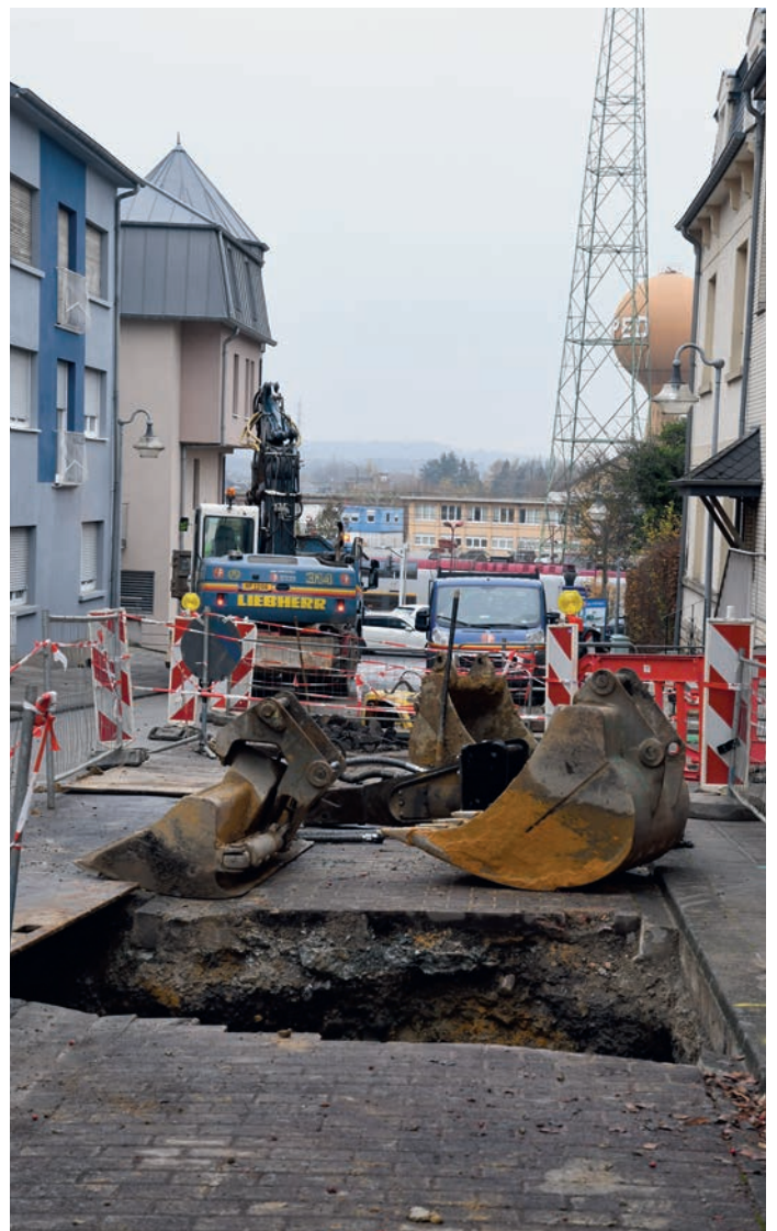
A ville Stroossen (hei an der rue Adolphe zu Rodange) goufen d'Infrastrukturen esouwéi de Belag erneiert