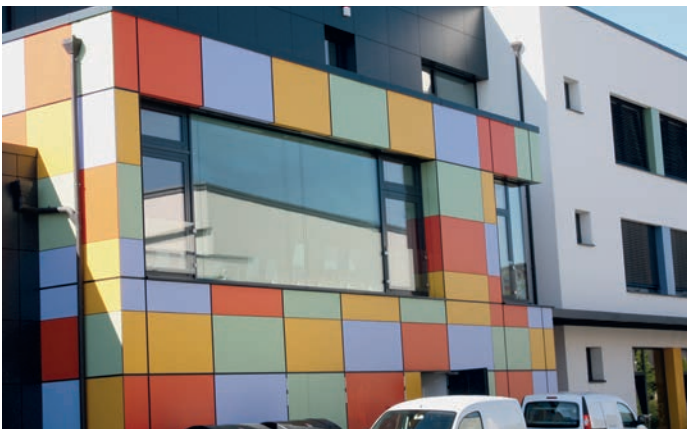
Direkt un der fuerweger Fassade z'erkennen: d'Maison Relais zu Péiteng

An der Tëschenzäit goufen d'Schoulhäff an der Gemeng erneiert. D'lescht Joer krut och deen ënneschten Haff vun der Park-Schoul zu Péiteng e ganzt neit Gesiicht, wou d'Kanner sech elo austobe kënnen.